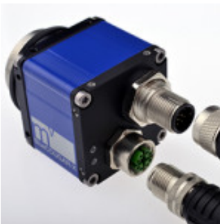
Connecteur industriel modulaire M12 pour mvBlueCOUGAR-X