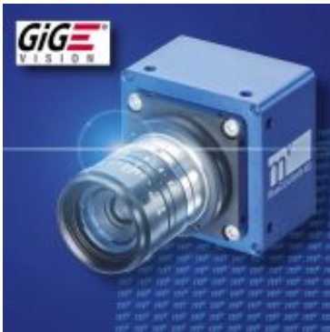
mvBlueCOUGAR-XD mvBlueCOUGAR-XD – tree nuovi sensori CCD quad tap disponibili