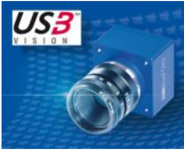
mvBlueFOX3 Telecamere USB3 Vision con sensori da 3 e 10 Mpixel ora in produzione